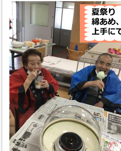
夏祭り 綿あめ、かき氷、金魚すくい 上手にできました！

本日もご利用者様とのお話を大事にしなが、ちょっと普段と違うことを一緒に楽しんでます。