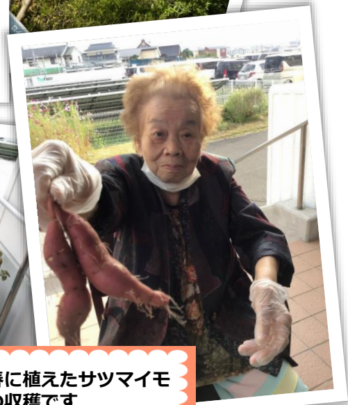
春に植えたサツマイモ の収穫です 小さくてかわいいね♥