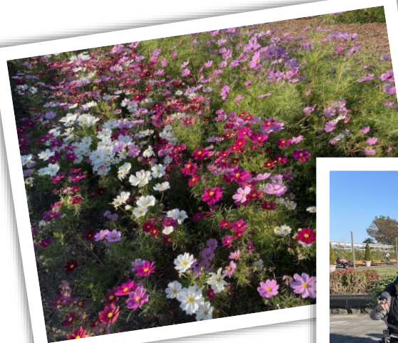
農業園芸センターへ きれいなお花とみんな の笑顔がサイコー！！