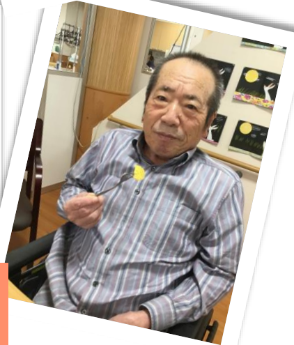
いただいたかぼちゃで パウンドケーキを作りました！！