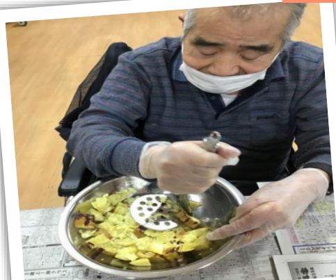
収穫したサツマイモを サクサクおさつポテトと スイートポテトにして完食