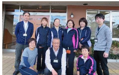
ケアハウスインいわきりスタッフ

そして最も皆さんにご安心いただいている点は、『岩切病院が隣り』という立地です。医療と介護との緻密な連携は、今後一層追求されなければならない大切な分野であり、皆さんがより安全で健康な生活を営む上で欠かせないものです。いざという時は勿論、日常の体調管理にも安心感を持てることが一番ではないでしょうか。あなたも元気なお年寄り達の仲間に入りませんか。見学は随時承っております。