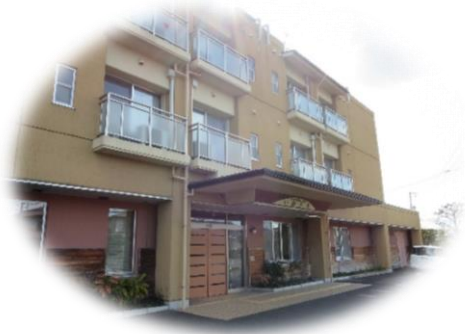
ケアハウスインいわきり